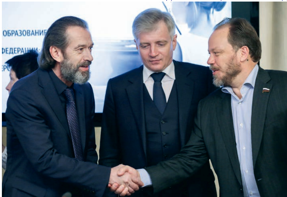
«Круглый стол» Комитета по культуре на тему «Художественное образование в Российской Федерации: проблемы и перспективы»

Вы знаете, пожалуй, за все время Госдумы это был единственный законопроект, который принимался под аплодисменты всего зала. Никаких межфракционных трений не было, наоборот, все как один говорили — это хорошо и правильно. Единственная претензия, которая при этом высказывалась, — почему мы делаем послабления для культуры, в то время как его вообще-то надо сделать для всех. Я, безусловно, согласен с тем, что нужно бороться с коррупцией, нужно давать возможности для малого и среднего бизнеса, но это невозможно сделать таким путем, принцип минимальной цены поставки — это неверный подход, особенно применительно к тем процедурам, которые осуществляются в специальных областях, в частности в культуре.