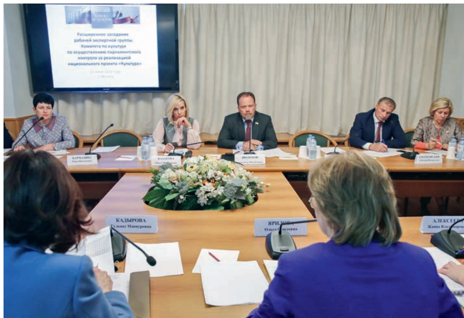
Заседание рабочей экспертной группы по осуществлению парламентского контроля за реализацией национального проекта «Культура»

Не повернется язык сказать о региональных и муниципальных музеях, будто их роль второстепенна, что это некое нижнее звено. Во-первых, эти музеи зачастую хранят предметы, которым могут позавидовать коллекции известных больших собраний, а во-вторых, они выполняют огромную социальную функцию. И на мой взгляд, можно поставить знак равенства, или не сравнивать вообще, что было бы правильнее. Иметь возможность посетить музеи, скажем, Кремля и Эрмитаж, и возможность посетить вдумчиво музей, особенно для детей, в родном месте, где тебе расскажут откуда есть и пошли.